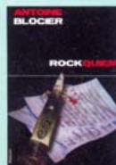
Antoine Blocier Rockquiem