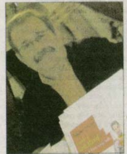
Des pamphlets, tel ce « Sarkoland », mais aussi du polar.

Parmi les auteurs, en voilà un à découvrir, assurément. ■ F. C.