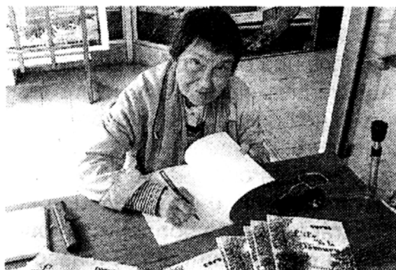
Corsi dédicacera « L'île de la détourne ».